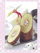
千年杉(姫路市) 生地がしっとりふわふわのバームクーヘン。