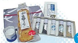
赤穂特産品詰め合わせ(赤穂市) 塩ラスクや塩あめなど、塩製品の詰め合わせ。