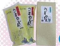
円心モロどん2袋入(上郡町) ヘルシーなモロヘイヤを練り込んだうどん。