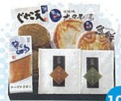
蒲鉾の詰め合わせ(姫路市) 東宮御所に献上したこともある老舗の蒲鉾。