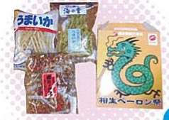
うまいかと雷満月詰め合わせ(小)(相生市) 長く愛されているおやつ。後を引くおいしさ。