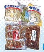
うまいかと雷満月詰め合わせ(大)(相生市) 相生発のお土産といえばこれ。素朴な味わい。