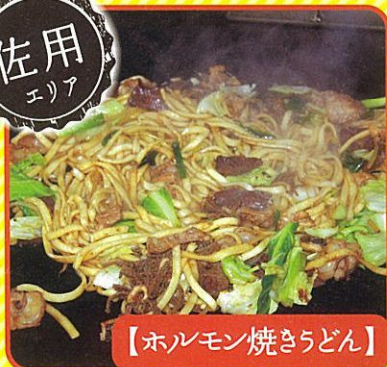
【ホルモン焼さうどん】