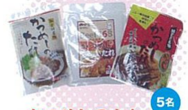
かつめしのたれ詰め合わせ(加古川市) ご家庭でお気軽に、プロの味を食べ比べ。