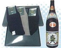
くつしたと金鶏盛典(地酒)のセット(加古川市) 地場産業のくつしたと、芳醇かつ淡麗な酒。