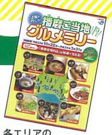
各エリアのスタート地点は裏表紙をご覧ください。

異なるエリアの参加シールを3枚以上集めて、パンフレットに付いている専用ハガキで事務局へ送付すると、抽選で「3エリア賞」が当たります。全8エリアの参加シールを集めると、「完歩賞(8エリア賞)」に応募できます。