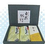
円心モロどん4袋入(上郡町) モロヘイヤを練り込んだ喉ごしの良いうどん。