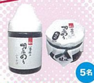
明石のりふりかけ&たこ入明石のり佃煮セット(明石市) 香り豊かなふりかけと贅沢なタコ入り佃煮。