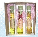
プレミアムオイル詰め合わせ(佐用町) 佐用町産100%の無添加まわり油がベース。