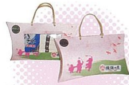
そうめん詰め合わせ(たつの市) 全国的に有名な手延素麺・損保乃糸のセット。