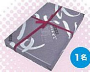
塩味まんじゅう(赤穂市) ご存じ赤穂銘菓。お茶うけにぴったり。