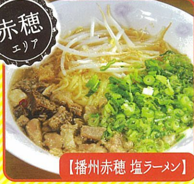
【播州赤穂 塩ラーメン】